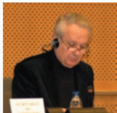
Jean-Marie Cavada, Presidente de la comisión LIBE

El lanzamiento oficial de la edición 2007 del Programa de Intercambios de las Autoridades Judiciales tuvo lugar los días 19-20 de marzo pasados en el Parlamento europeo. Como se informa en el último número de « La carta de la REFJ » (marzo de 2007), la ceremonia de lanzamiento se celebró el 19 de marzo y contó