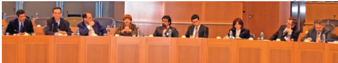
Lanzamiento oficial del Programa de Intercambios el 19 de marzo de 2007 en el Parlamento europeo, en Bruselas