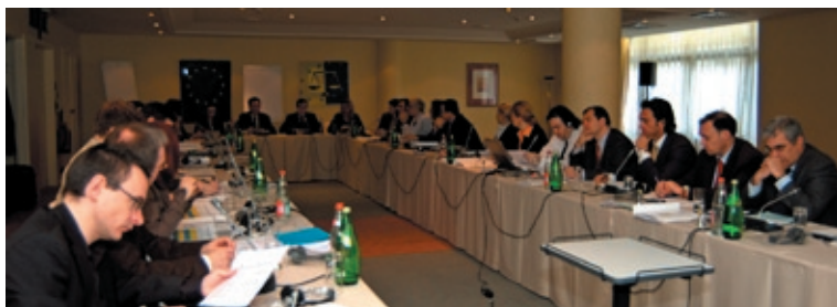
La reunión técnica del grupo de seguimiento en Bruselas

Paralelamente a dichas actividades, la REFJ siguió con su estudio sobre viabilidad iniciado en 2005 para identificar los obstáculos a una participación activa en los intercambios y sobre los medios para seguir desarrollando en el futuro las posibilidades ofrecidas por el Programa de Intercambios.