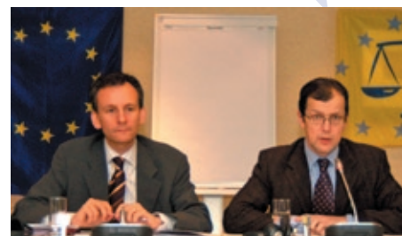
Gilles Charbonnier y Peter Csonka de la Comisión europea

La audición ante la comisión LIBE iba seguida los días 20-21 de marzo de 2007 por una reunión del grupo de seguimiento del Programa de Intercambios en presencia de Peter Csonka, Jefe de la Unidad D3—justicia penal de la Comisión europea. El grupo de seguimiento del Programa de Intercambios recoge todos los puntos de contacto de las instituciones participantes (ver lista de participantes en página 4). Se reúne unas dos veces al año para repartir los intercambios entre los diferentes países participantes, para evaluar las actividades organizadas y preparar los programas futuros.