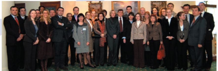
Reunión de los puntos de contacto del Programa de Intercambios, el 20 y 21 de marzo de 2007 en Bruselas

*Excepto para los intercambios de magistrados de los Tribunales Supremos, y de los Consejos Supremos de Justicia, a quienes se aplica un dispositivo específico en colaboración con las redes correspondientes.